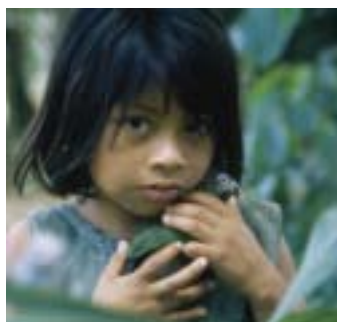
Petite fille Machiguenga à Timpia, l'une des communautés directement touchées par le gazoduc Camisea au Pérou.

Dans le monde, 70% des pauvres sont des femmes. Il n'existe pourtant aucune disposition particulières pour garantir qu'elles profitent des industries extractives (mines, pétrole et gaz).