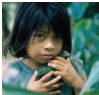
Mačigena meitene Timpiā – vienā no kopienām, ko tieši ietekmē Camisea gāzes cauruļvads Peru.

70 procenti no pasaules nabadzīgajiem iedzīvotājiem ir sievietes, taču netiek realizēti īpaši pasākumi, lai viņas gūtu labumu no ieguves rūpniecības projektiem – naftas, gāzes un kalnrūpniecības sektoros.