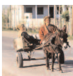
Kohalikud Qarabork'is, Azerbaidžaanis Bakuu-Ceyhan naftajuhtme lähedal.