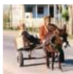
Quarabork, obec v Azerbajdžane v blízkosti ropovodu Baku-Ceyhan.