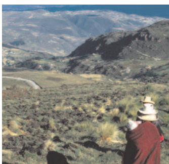
Kohalik pere Yanacocha kullakaevanduse juures Peruu.