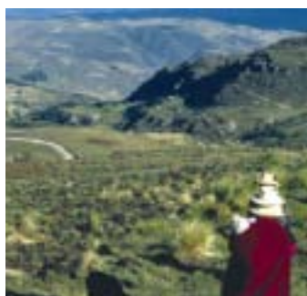
Famille riveraine de la mine d'or de Yonacocha.