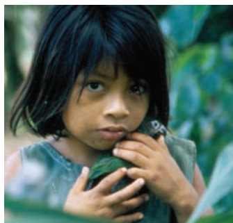
Dziewczynka z ludu Machiguenga z rejonu Timpia. Jednej ze społeczności bezpośrednio doświadczającej skutków budowy gazociągu Camisea w Peru.

70% ubogich na świecie to kobiety, jednak nie istnieją żadne konkretne rozwiązania, które mogłyby zapewnić, aby korzystały one z projektów związanych z przemysłem wydobywczym – z wydobywaniem ropy naftowej, gazu ziemnego i górnictwem.