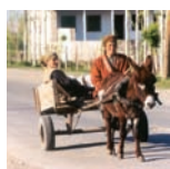
Wózek ciągnięty przez ośa w Qarabork, w Azerbejdżanie nieopodal rurociągu Baku-Ceyhan w rejonie Morza Kaspijskiego.