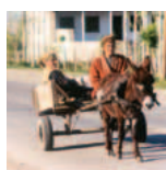
Ēzeļa diviči Kvaraborkas tuvumā Azerbaidžānā, netālu no Baku-Čeihjanas naftas cauruļvada Kaspijas reģionā.