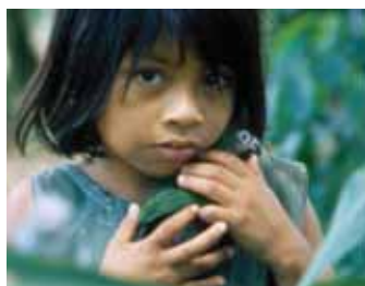
Dievča z kmeňa Machiguenga v peruánskej Timpíi. Jej komunita je priamo zasiahnutá plynovodom Camisea.

Ženy sa na celosvetovom počte chudobných ľudí podieľajú až 70-timi percentami, žiadne špeciálne opatrenia im však nezabezpečujú podiel na zisku z ťažobného priemyslu – či už ide o ťažbu ropy, zemného plynu alebo o baníctvo.